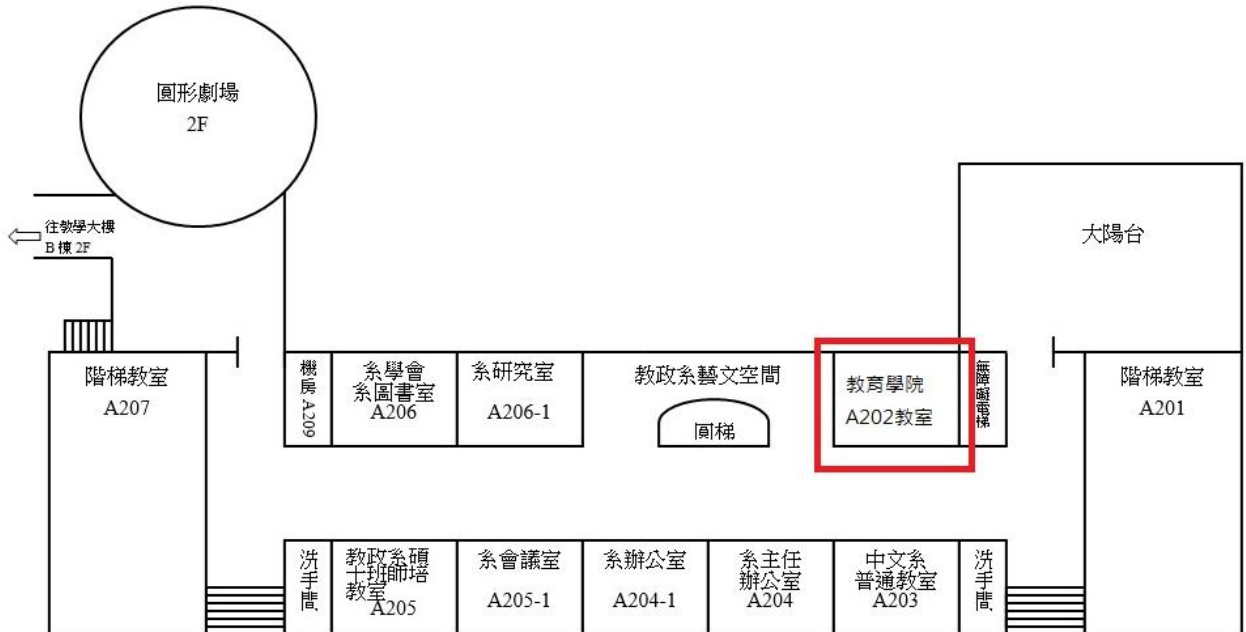
教育學院二樓平面圖